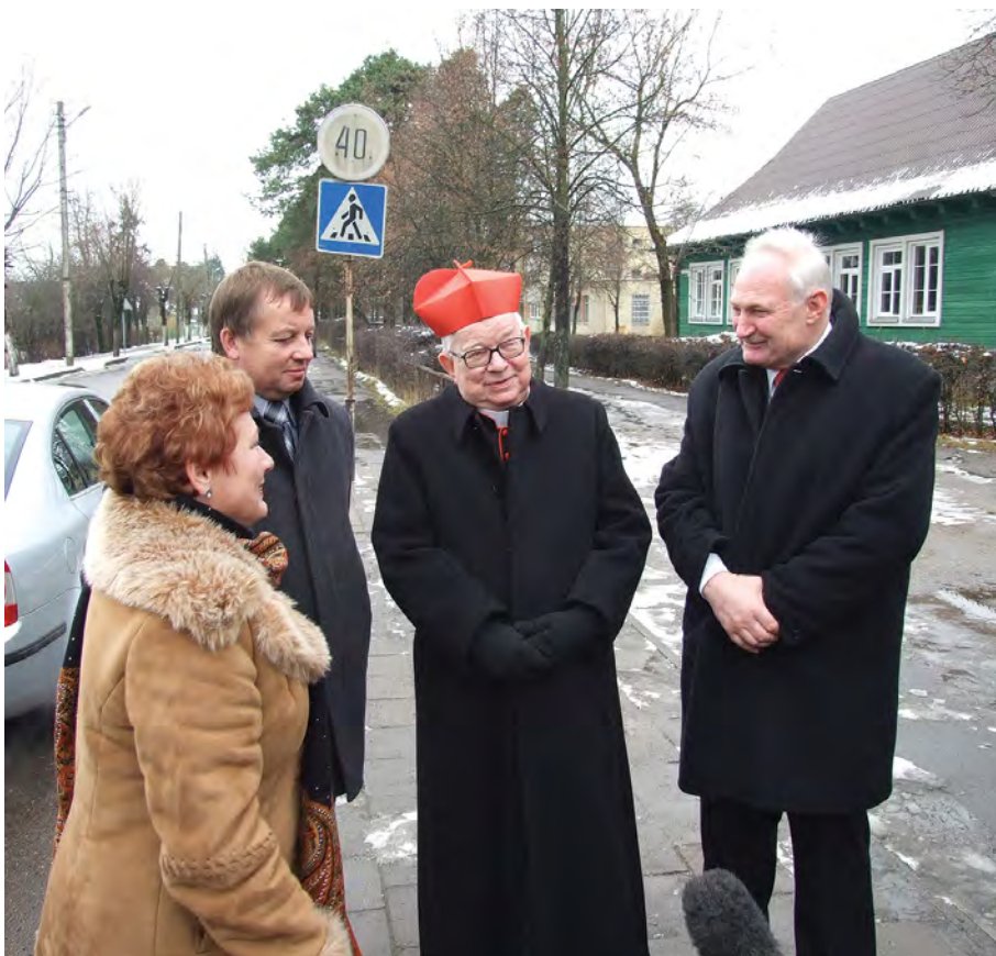
Rok 2007. Wizyta jego ekscelencji kardynała H. R. Gulbinowicza w gimnazjum

Nasi pedagodzy potrafią dzielić się doświadczeniem dydaktyczno-wychowawczym na skalę krajową. Centrum Doskonalenia Nauczycieli w Wilnie w 2007 r. zorganizowało wystawę prac metodycznych nauczycieli szkół mniejszości narodowych. Wśród uczestników wystawy znalazło się nasze gimnazjum. Należy zaznaczyć, że wiele przez nas prezentowanych prac zostało przeniesione do działu wystawy stałej i demonstrowane tam w ciągu roku.