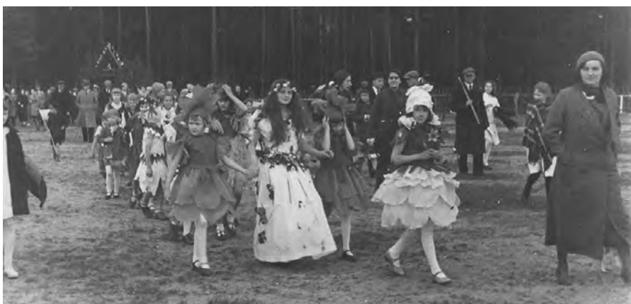
Rok 1932. Święto Wiosny. Uczniowie w maskach na terytorium dzisiejszego stadionu