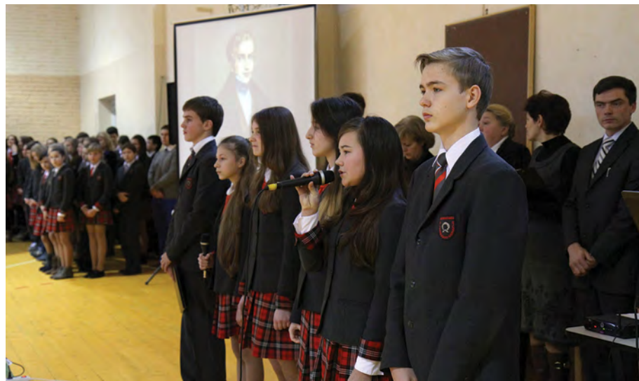
Rok 2013. Uroczysty apel z okazji Dnia Patrona gimnazjum i Święta Odrodzenia Niepodległości Rzeczypospolitej Polskiej

zrobione upominki. Po lekcjach odbywa się koncert, na który są zapraszani goście i nauczyciele – emeryci. Pomysły artystów są zadziwiające. Potrafią przenieść słuchaczy do odległej przeszłości lub do przyszłości, razem z widzami są twórcami i aktorami. Stały temat – to lekcja i nauczyciel. Nie brak tu humorystycznych spostrzeżeń. W tym dniu dyrekcja gimnazjum nagradza zasłużonych nauczycieli dyplomami honorowymi. Starosta miasta Niemenczyn wręcza prezenty i kwiaty.