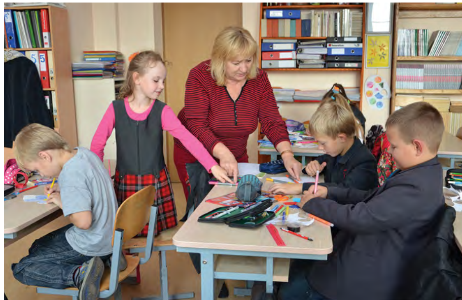
Rok 2015. Zajęcie kółka plastycznego

Z dziennikarzami ściśle współpracuje kółko fotograficzne. Uczniowie uczestniczą w konkursach, chętnie doskonalą swe umiejętności podczas różnorodnych szkoleń i warsztatów. W tym roku brali udział w szkoleniach Akademii Liderów Polonii Stowarzyszenia „Wspólnota Polska” w Pułtusku. Wysłuchali teoretyczny i praktyczny kurs „Jak zostać dziennikarzem”.