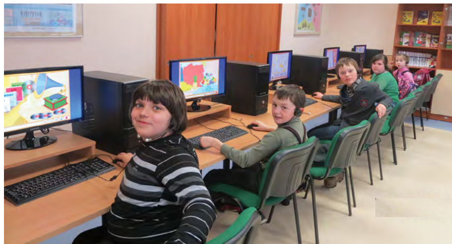
Rok 2015. Podczas jednego z zajęć kółka miłośników IT

Celem studia jest twórcze wypełnienie czasu wolnego dziecka poprzez pobudzenie i rozwój jego twórczej aktywności. Warsztaty rysunku i malarstwa adresowane są do uczniów klas początkowych. Uczestnicy zapoznają się z różnymi technikami plastycznymi, uczą się prawidłowej kompozycji, podnoszą swoje umiejętności. Pracują z gliną, masą solną, wykonują origami. Cechą tej dyscypliny jest trójwymiarowość, która rozwija zdolności manualne i wyobraźnię przestrzenną. Kształci cierpliwość i prawidłowość form. Prace uczniów upiększają salę konferencyjną gimnazjum i klasy. Biorą również udział w licznych konkursach plastycznych, plenerach artystycznych oraz wystawach.