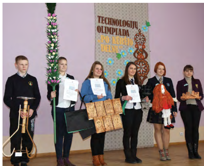
Rok 2015. Wśród laureatów rejonowej olimpiady z technologii

Doskonałą się też sami nauczyciele opiekujący się najzdolniejszymi uczniami i wykorzystujący zdobytą przy tej okazji wiedzę w całości pracy dydaktycznej. To wszystko służy szkole i świadczy o doskonaleniu procesu edukacyjnego.