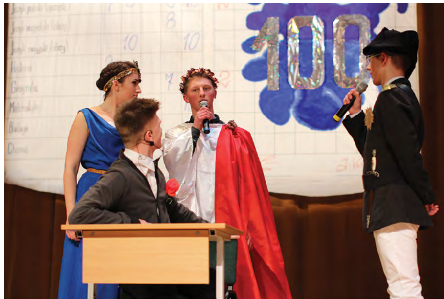
Rok 2015. Migawka z programu studniówki

Pierwsze studniówki odbywały się w szkole. Najczęściej uczniowie byli bez makijażu i nawet w mundurkach, bawili się we własnym gronie. Przygotowywano się do imprezy nadzwyczaj starannie, bo to było ambicją każdej klasy wpisać się w historię szkoły w sposób najbardziej oryginalny. Już od września uczniowie układali program, dyskutowali, szykowali kostiumy do występów. Ulubionymi tematami były satyry, kuplety, fragmenty utworów literackich, kabarety, podróże historyczne i kosmiczne, filmy.