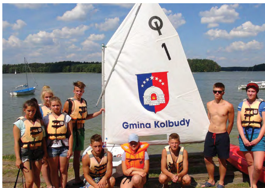
Rok 2014. Grupa uczniów gimnazjum podczas pobytu na obozie żeglarskim

Z tymi pracami mogli zapoznać wszyscy odwiedzający wystawę.