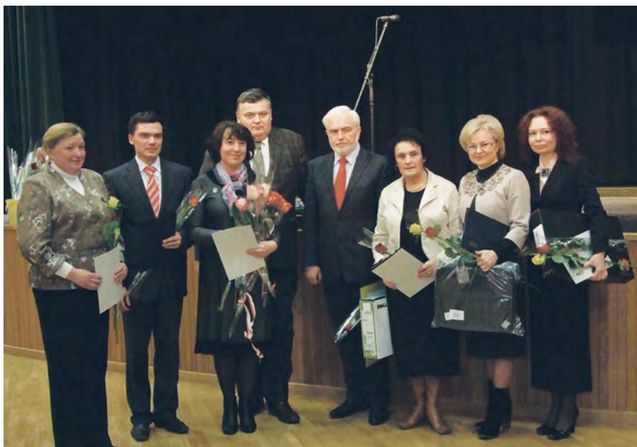
Rok 2011. W gronie najlepszych polskich szkół na Litwie