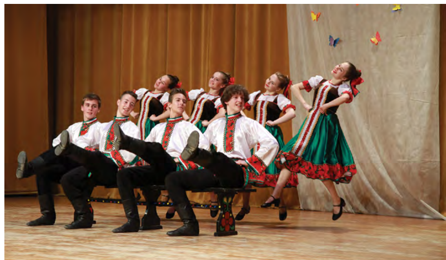
Rok 2015. Taniec „Skamiejka” w wykonaniu tancerzy „Perły”

dramat „Dziady” część II, poemat „Pan Tadeusz”. Okazyjne wieczorki poetyckie są poświęcane twórczości Czesława Miłosza, Konstantego Ildefonsa Gałczyńskiego, Wisławy Szymborskiej, Juliana Tuwima. Klasy z rosyjskim językiem nauczania w ramach obchodów „Jesieni Puszkiniowskiej” wiele uwagi poświęcają wybitnemu poecie, jak również twórczości Lermontowa, Tiutczewa, Jesienina innych słynnych poetów rosyjskich. Pięknie uczczono 200 rocznicę urodzin Michaiła Lermontowa. Doskonała recytacja, stylowe XIX-wieczne stroje, dobrze dobrana oprawa muzyczna zachwyciły widownię.