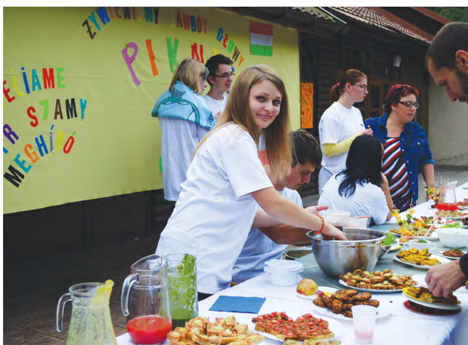
Rok 2014. „Żywniowy zawrót głowy”. Piknik

Roskoszy w partnerstwie z Litwą, realizowane w ramach programu „Młodzież w działaniu”. Zakres programowy spotkania obejmował działania o charakterze rekreacyjnym i edukacyjnym. Głównym celem działań była integracja młodych ludzi, pogłębianie zrozumienia pomiędzy młodzieżą w środowisku międzynarodowym, poznawanie innych kultur. Młodzież realizowała wspólne zainteresowania aktywnego spędzania czasu na świeżym powietrzu, doceniając wartość przyrody i potrzebę jej ochrony.