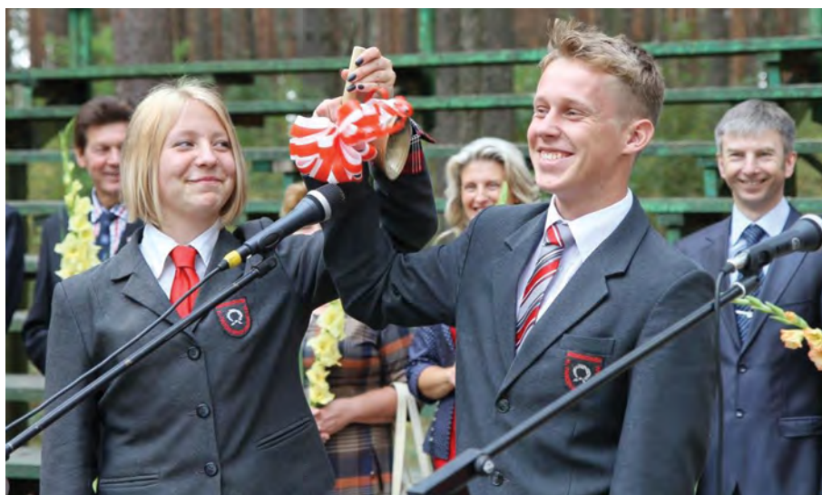
Rok 2015. Pierwszy dzwonek w rękach maturzystów