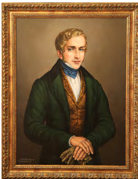
Portret patrona gimnazjum K. Parczewskiego. Obraz olejny autorstwa S. Buczackiego, dar J. E. Kardynała H. R. Gulbinowicza dla gimnazjum