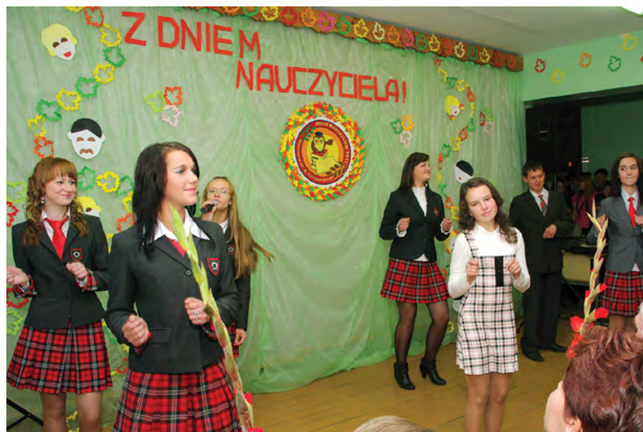
Rok 2010. Migawki z programu Dnia Nauczyciela