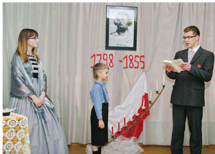
Rok 2009. Wieczorek twórczości A. Mickiewicza)