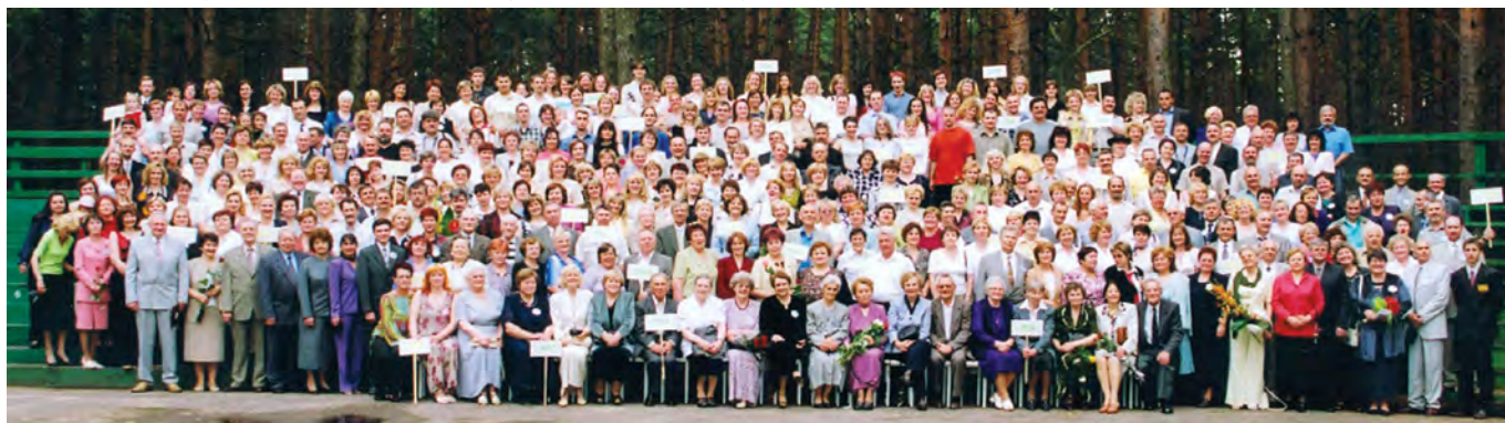
Rok 2004. Spotkanie 50 promocji - zdjęcie grupowe na estradzie

Rok 2005 zapisał się w dziejach szkoły jeszcze jednym doniosłym wydarzeniem. W tym roku mury szkoły opuszczała 50 promocja szkoły średniej. Była to świetna okazja, by wrócić pamięcią do lat szkolnych, spotkać swoich przyjaciół.