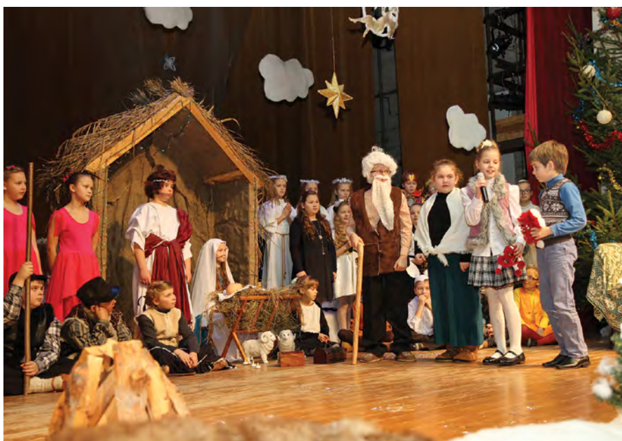
Rok 2014. Przedstawienie jasełkowe w wykonaniu uczniów klas czwartych