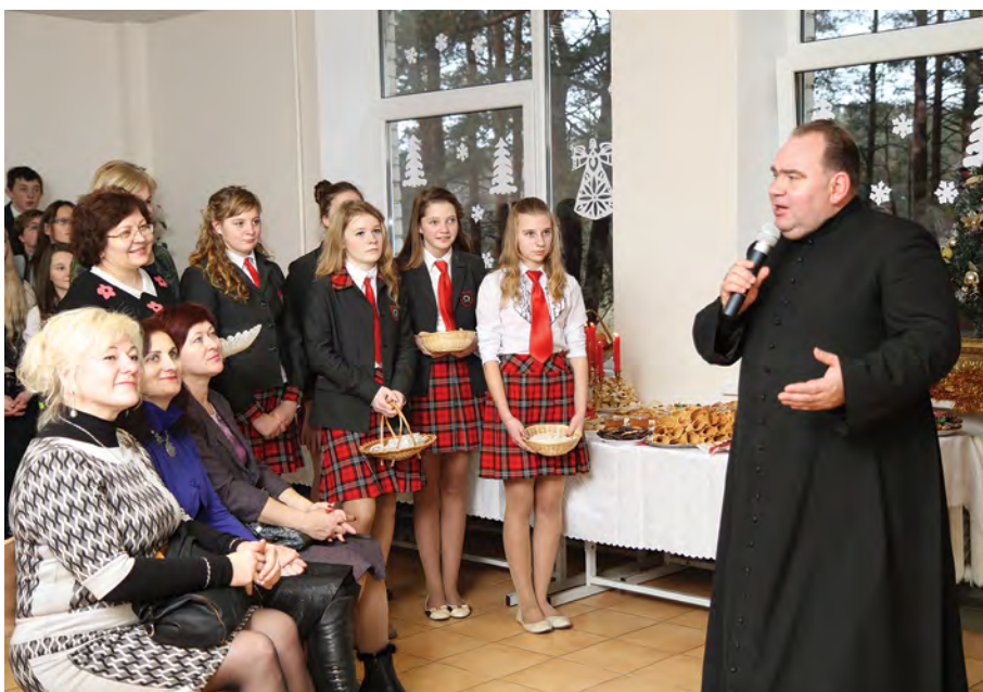
Rok 2014. Spotkanie oplatkowe

Dzień Odrodzenia Niepodległości Litwy najczęściej kupia uczniowie i młodzież naszą i wychowanków obok położonego gimnazjum litewskojęzycznego. Pięknym akcentem stała się ostatnio zainicjowana akcja obywatelska „Most Jedności”, jaka połączyła gości, grona pedagogiczne i uczniów obu gimnazjów. Był to żywy łańcuch, który opasał terytorium placówek oświatowych, podkreślając jednocześnie wspólne poparcie ideom wolnościowym.