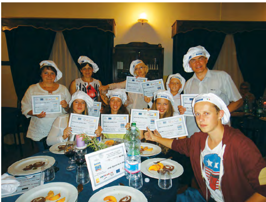
Rok 2014. Projekt FVF we Włoszech

„Azymut na aktywność” - 2012 r. Spotkanie młodzieży zorganizowane przez Europejskie Centrum Kształcenia i Wychowania OHP w