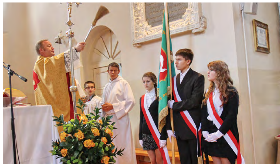
Rok 2012. Wyświęcenie sztandaru

W tym samym dniu zostało odsłonięte popiersie Konstantego Parczewskiego dłuta rzeźbiarza Zygmunta Rząpa.