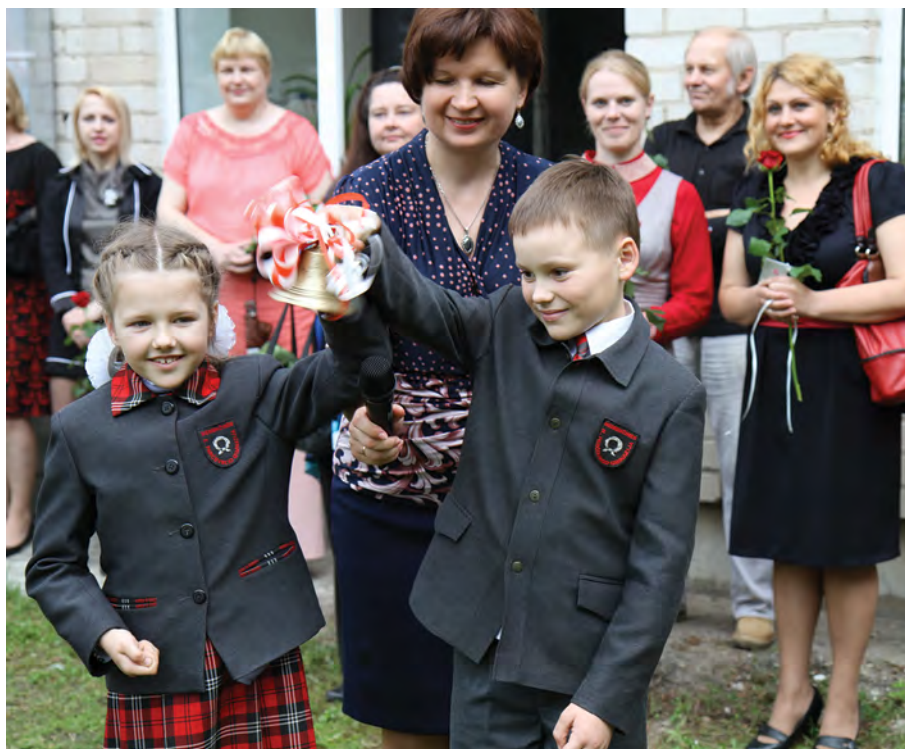
Rok 2014. Pożegnalny dzwonek w rękach uczniów klas początkowych

Każdego roku grudniowy wieczorek literacki poświęcamy twórczości Wielkiego Romantyka Adama Mickiewicza. Przedstawiane są fragmenty biografii, recytacje bajek i sonetów, jednak największą popularnością cieszą się ballady i utwory dramatyczne. W 2015 roku swą pomysłowością zachwycili uczniowie klas G4 (12-tych), wystawiając balladę „Lilie” w wersji śpiewanej. Swych inscenizacji doczekały się inne ballady, powieść historyczna „Konrad Wallenrod”,