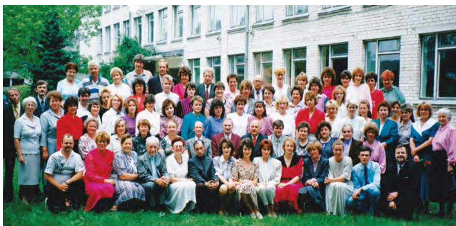
Rok 1995. Grono nauczycieli szkoły