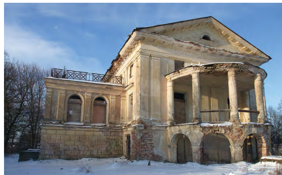
Dwór Parczewskich. Stan obecny

świadczą też dobre wyniki egzaminów państwowych. Szkoła jest wysoko oceniana przez władze samorządu rejonu wileńskiego. W konkursie „Najlepsza Szkoła Rejonu Wileńskiego” za lata 2003–2006 zdobyliśmy I miejsce. Na uwagę zasługują również absolwenci, którzy, będąc uczniami tej szkoły, powrócili do niej już jako nauczyciele. Ten pierwszy, może nieduży jubileusz przypomina, że w gimnazjum pierwszeństwo ma uczeń, siłą przewodnią są – nauczyciele i wychowawcy, wsparciem – rodzice, a dumą – absolwenci.