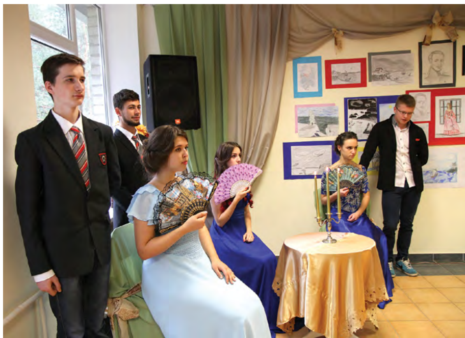
Rok 2014. Popołudnie literackie twórczości M. Lermontowa

odbywają się konkursy recytatorskie, kaligraficzne, językowe, wiedzy o Polsce i literaturze polskiej, prezentacja historycznych stolic Polski, zabawy, czytanie wybranych utworów. Kończymy tydzień podsumowaniem wyników i wieczorkiem literackim bądź grupową inscenizacją wybranego utworu. Poza tym obchodzimy Świątowy Dzień Tabliczki Mnożenia, Dzień Języków Europejskich i inne okazyjne święta przedmiotowe.