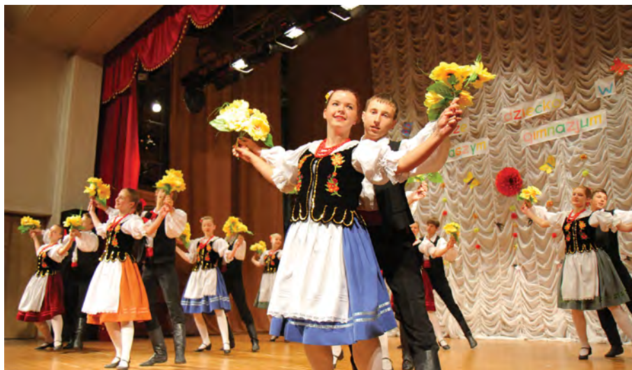
Rok 2012. Prezentacja dorobku „Perły” podczas kolejnej konferencji