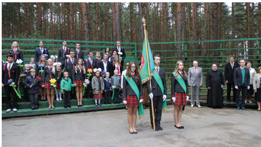
Rok 2014. Uroczysty apel z okazji „Święta Wiedzy”

W naszym gimnazjum 5 października jest obchodzony Międzynarodowy Dzień Nauczyciela. Święto szykują uczniowie klas trzecich i dziesiątych. Już przed lekcjami spotykają nauczycieli z muzyką, składają życzenia, wręczają miłe własnoręcznie