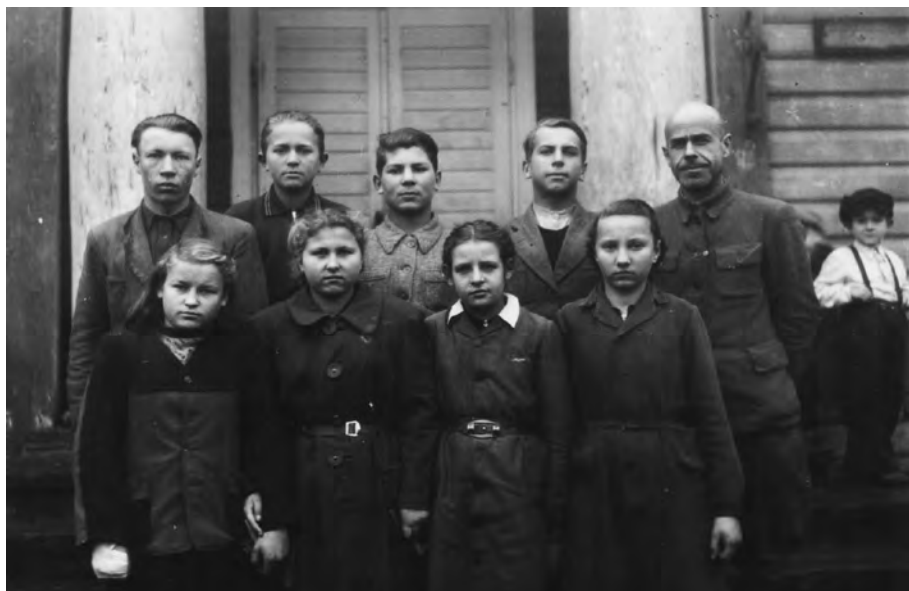
Rok 1947. Promocja szkoły siedmioletniej

Okres lat 50 – tych charakteryzuje się wzmożoną sowietyzacją i wprowadzaniem nowego stylu życia i świąt. Na porządku dziennym była walka z religią, udział w demonstracjach majowych i listopadowych, działalność organizacji partyjnej, komsomolskiej, pionierskiej. Wyjazdy na obozy do kołchozów i socjalistyczne współzawodnictwo pracy.