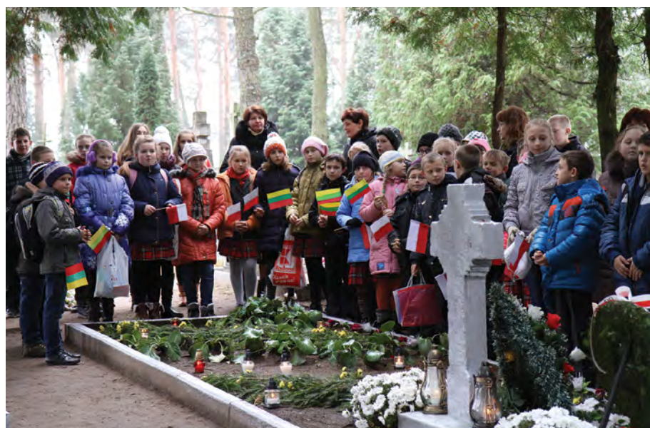
Rok 2013. Przy kwaterach nieznanym żołnierzom