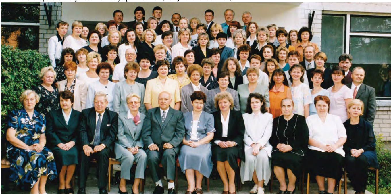
Rok 2000. Zdjęcie nauczycieli szkoły

W 1973 roku po zakończonych budowach uczy się 1222 uczniów (maksymalna liczba uczniów).