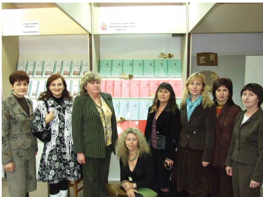
Rok 2007. Nauczyciele przy stoisku szkoły podczas otwarcia wystawy prac metodycznych w Centrum Doskonalenia Zawodowego Nauczycieli w Wilnie