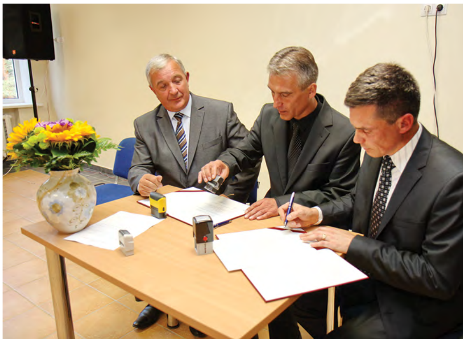
Rok 2012. Podpisanie umowy o współpracy ze Związkiem Gmin Wiejskich Województwa Podlaskiego

Wielki polski romantyk Cyprian Kamil Norwid powiedział: „Trzeba koniecznie pamiętać, skąd się wyszło...”