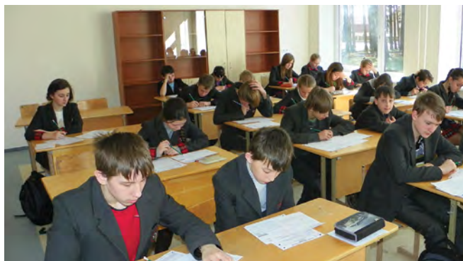
Rok 2012. Podczas zmagani w konkursie matematycznym „Kangur”