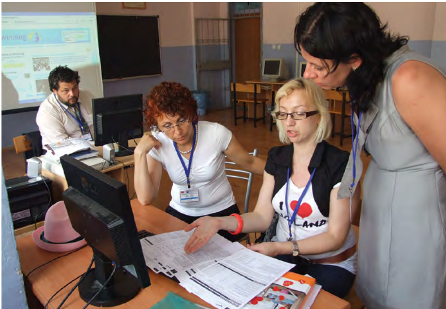
Rok 2012. Koordynatorzy projektu „European Start” podczas omawiania działalności projektowej

Należy zaznaczyć, że wszystkie wydatki, czyli podróże, pobyt za granicą i lokalna