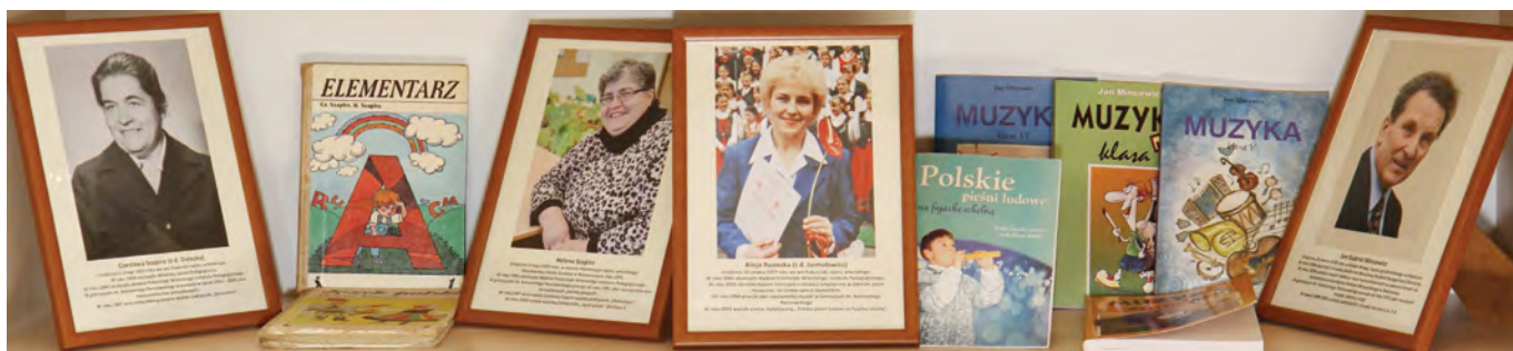
Zdjęcie nauczycieli – autorów podręczników wraz z wydanymi pozycjami