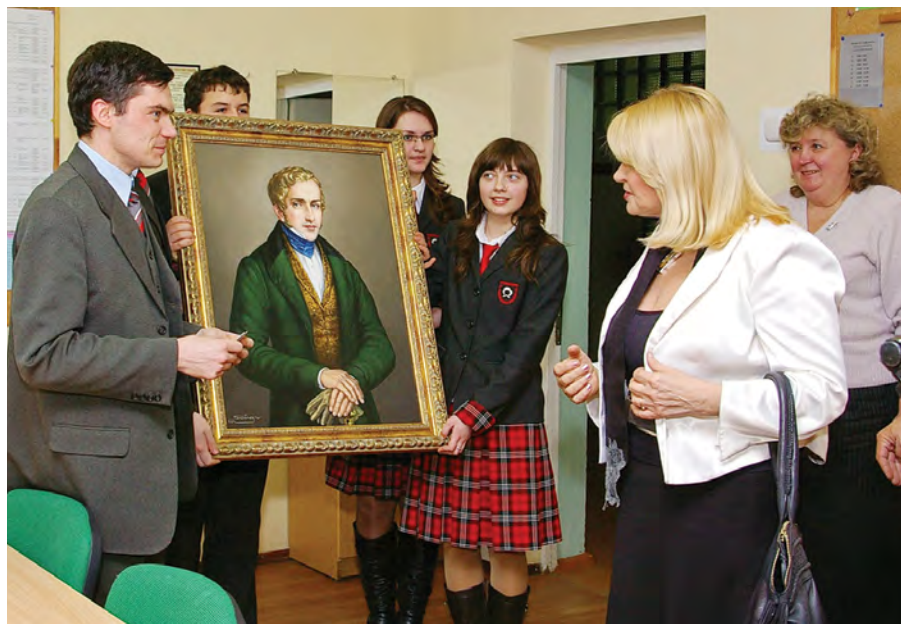
Rok 2008. Akt przekazania obrazu patrona dla gimnazjum