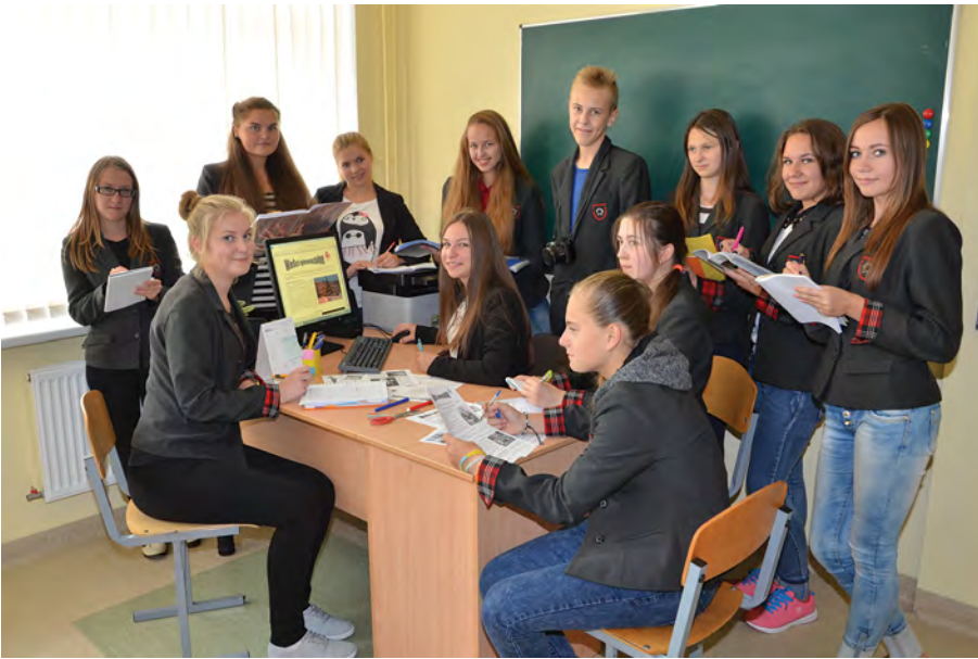
Rok 2015. Grupa redakcyjna podczas łamania kolejnego numeru