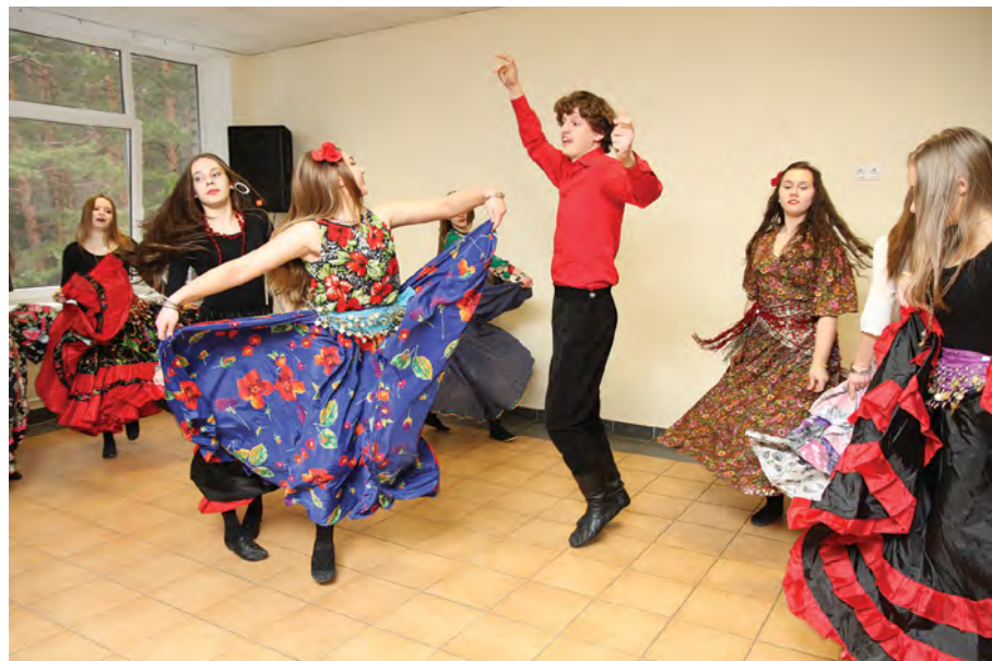
Rok 2015. Uczniowie klas dziewiątych w rolach zapustników

spoza gimnazjum, prezentacje albo nawet filmy. Włączają postacie z reklam, filmów, satyr, świata polityki i tradycyjnie nauczycieli. Uczestnikami imprezy są także uczniowie klasy 11, którzy życzenia odchodzącym kolegom składają w postaci przygotowanego programu i uczestniczą razem w zabawie studniówkowej.