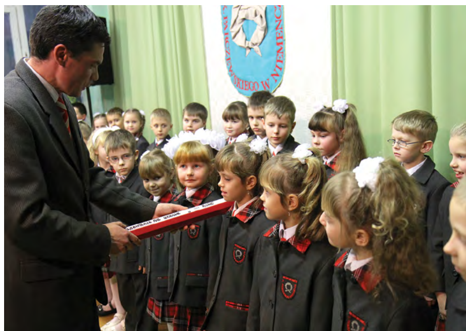
Rok 2011. Pasowanie na ucznia