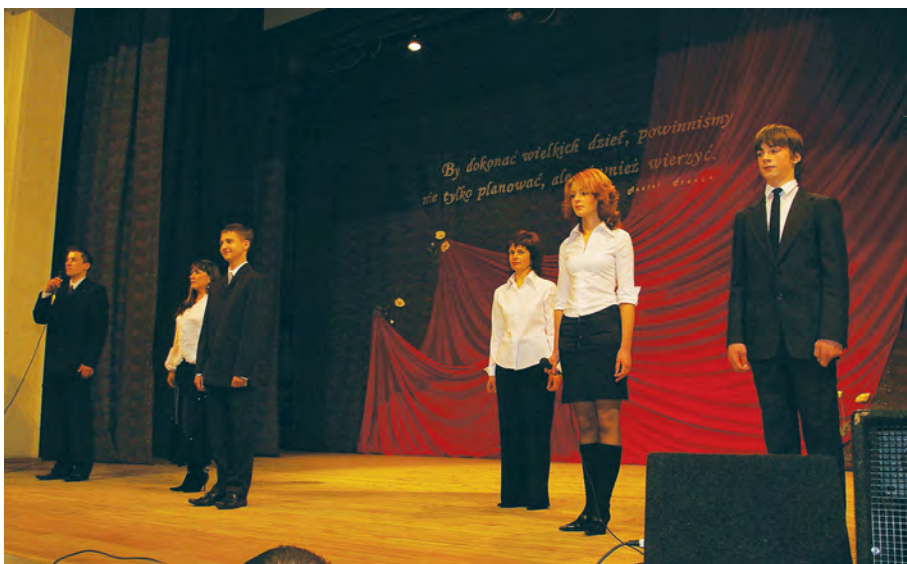
Migawka z uroczystości inauguracji gimnazjum