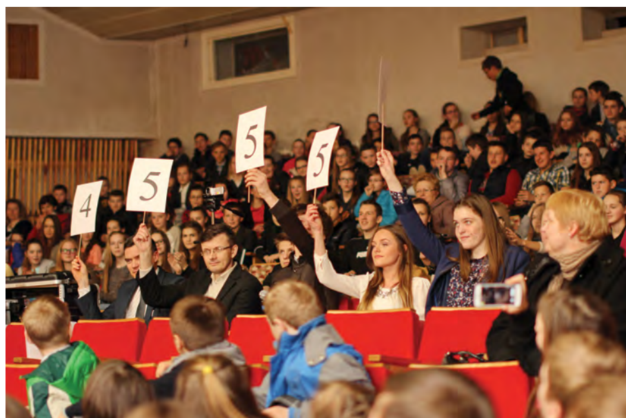
Rok 2015. Podczas konkursu talentów w ramach Dnia Ucznia

Uczniowie wraz z nauczycielami uczestniczą