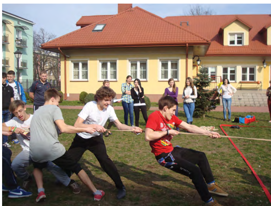
Rok 2014. Wyścigi sportowe