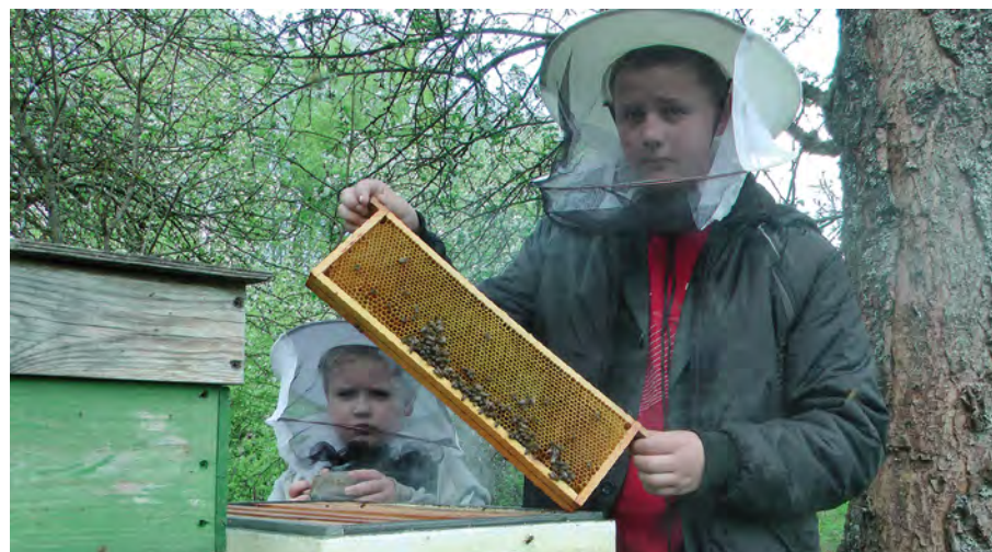
Rok 2014. Młodociani pszczelarze na pasiece