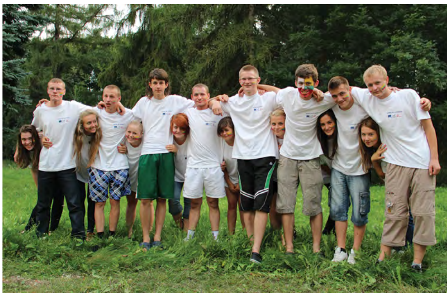
Rok 2012. Podczas spotkania w Roskoszy