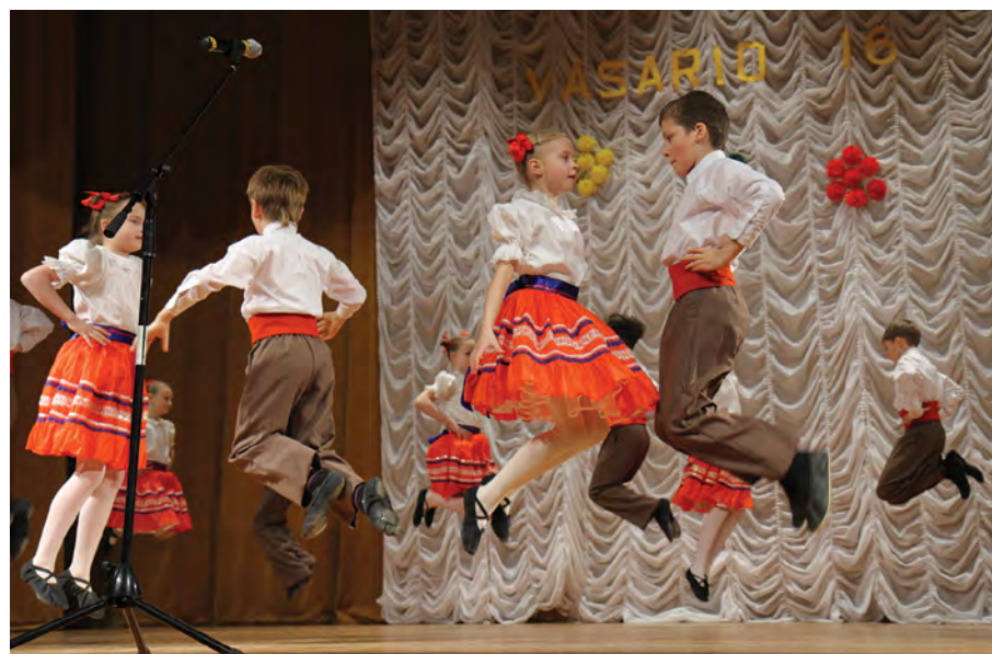
Rok 2012. Występ grupy tanecznej „Jutrzenka”