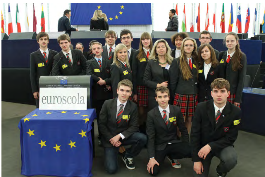
Rok 2012. Uczestnicy projektu w Parlamencie Europejskim