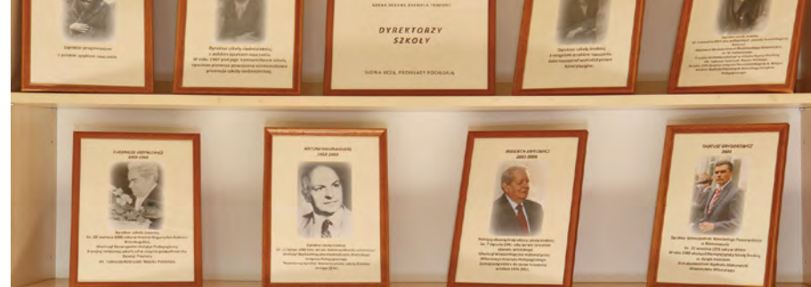
EKSPOZYCJA O DYREKTORACH SZKOŁY

Wystawę o szkolnictwie dopełniają sprzęty, o których dziś niewiele pamięta. Jest to ławka szkolna, pióro i kałamarz, z których korzystano przed 50 laty, najstarszy dziennik klasowy z roku szkolnego 1951-1952. Oddzielną gablotę zajmują mundurki szkolne, noszone przez uczniów za czasów sowieckich. Znajdują się także wzory mundurków, które posiadamy teraz. Wiele sprzętu technicznego, o którym dziś uczniowie prawie niczego nie wiedzą. Jest niewielki dział etnograficzny.