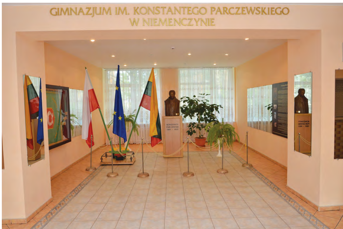
Foyer z popiersiem i sztandarami