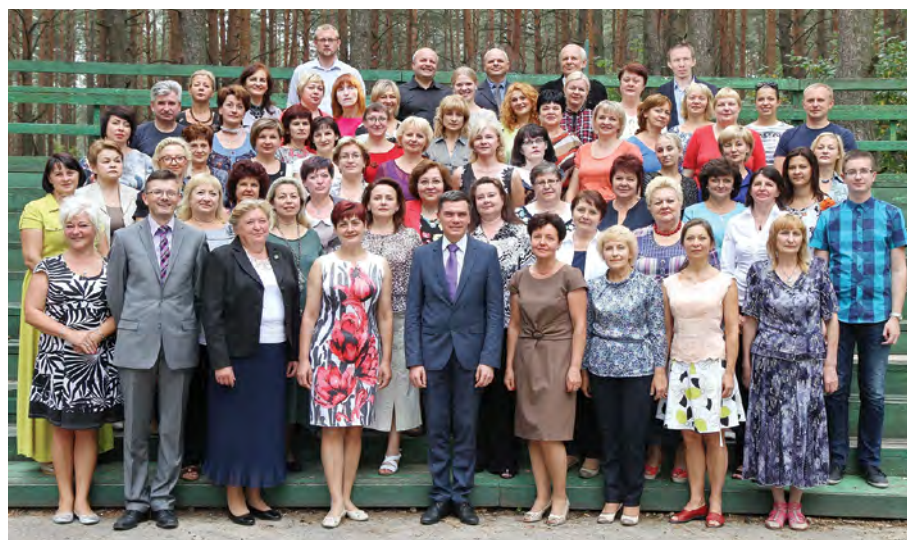
Rok 2015. Grono pedagogiczne gimnazjum