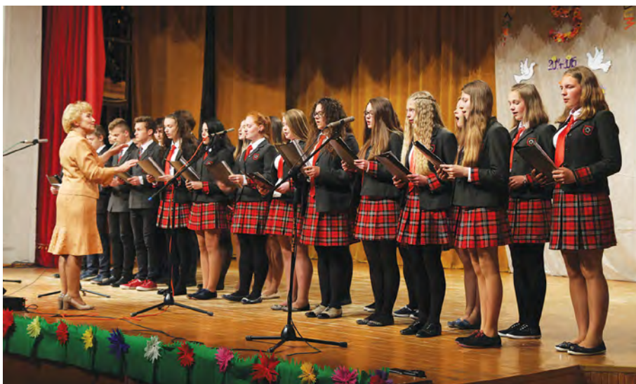
Rok 2015. Występ gimnazjalnego chóru „Jutrzenka”