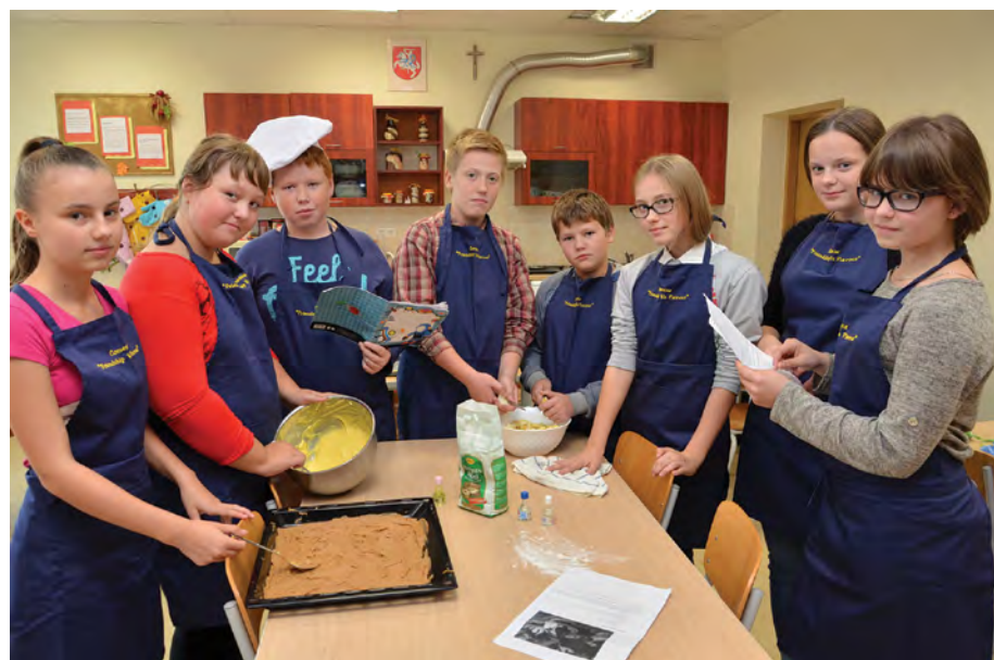
Rok 2015. Członkowie kółka w trakcie zajęć praktycznych

odbywają się konkursy recytatorskie, kaligraficzne, językowe, wiedzy o Polsce i literaturze polskiej, prezentacja historycznych stolic Polski, zabawy, czytanie wybranych utworów. Kończymy tydzień podsumowaniem wyników i wieczorkiem literackim bądź grupową inscenizacją wybranego utworu. Poza tym obchodzimy Świątowy Dzień Tabliczki Mnożenia, Dzień Języków Europejskich i inne okazyjne święta przedmiotowe.