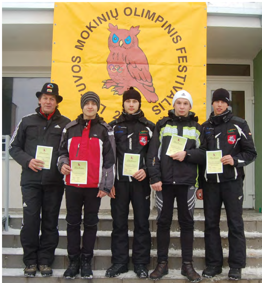
Rok 2010. Zwycięzcy festiwalu olimpijskiego