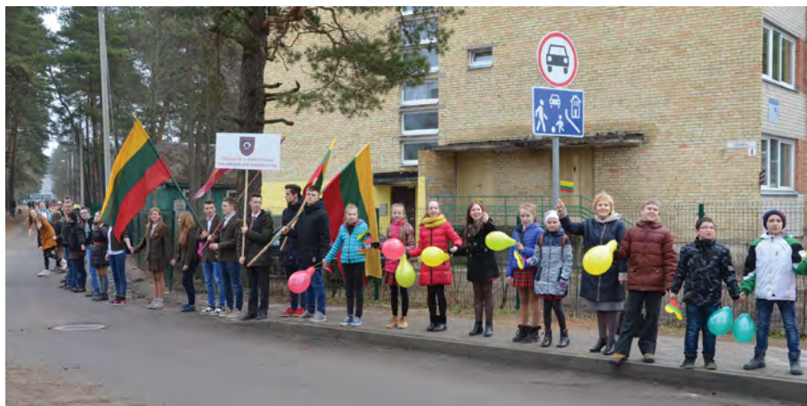
Rok 2015. „Most Jedności”