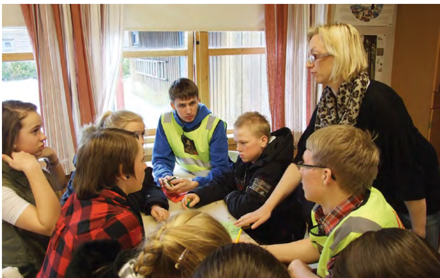
Rok 2013. Projekt SEAL w norweskiej szkole