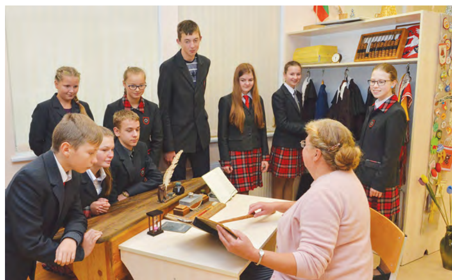
Rok 2015. Uczniowie podczas zwiedzania muzeum gimnazjum

W październiku obchodzony jest Międzynarodowy Miesiąc Bibliotek Szkolnych, w trakcie którego odbywają się różne uroczystości, wystawy, konkursy. Odbywa się akcja „Sprezentuj książkę bibliotece”.