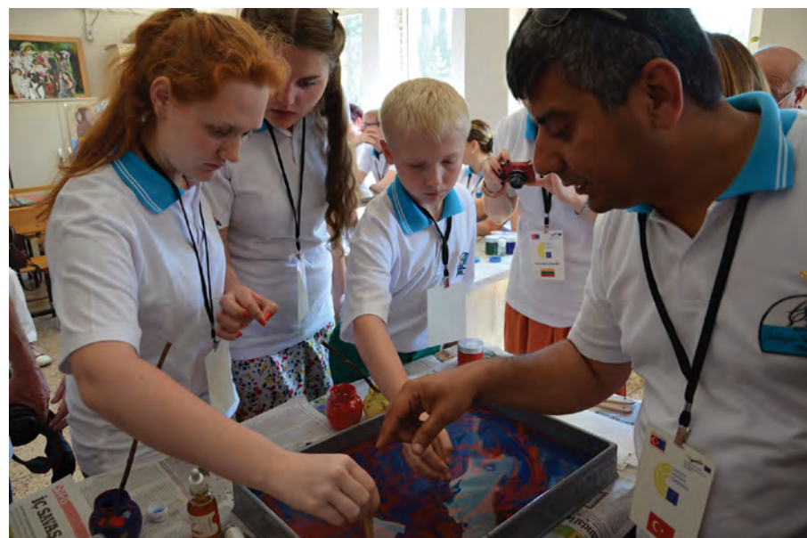
Rok 2015. Praktyczna działalność projektowa w tureckiej szkole