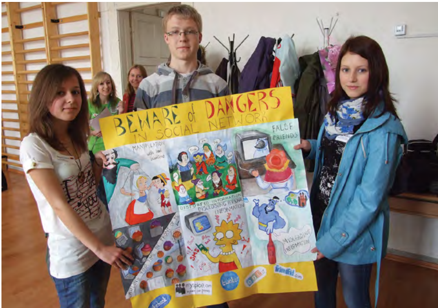
Rok 2011. Prezentacja dorobku działalności projektowej w Budapeszcie

rozstrzygnięcia. Uczniowie na temat szycanowania tworzyli opowieść muzyczną „Pinokio i KO”, poprzez którą starali się uzmysłwić zaistniałą niekomfortową sytuację i drogi wyjścia z niej. Na ten temat również zorganizowali wystawę rysunków, wydali informator o projekcie. Wielką wartość poznawczą miały wizyty w krajach partnerskich, w ramach których młodzież wymieniała się swym doświadczeniem, poznawała wartości kulturowe innych narodów.