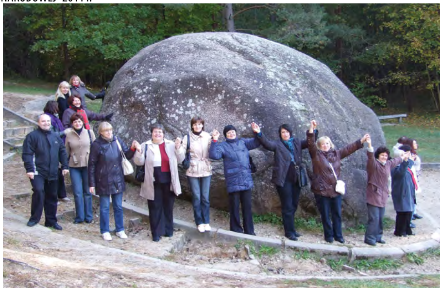
Rok 2010. Nauczyciele podczas jednej z wycieczek edukacyjno – poznawczych. Onikszy

Grono pedagogiczne naszego gimnazjum jest niezwykle zgrane i przyjazne. Znacznie wpływa na to fakt, iż poczynając od dyrektora, przytłaczająca większość nauczycieli – to wychowankowie szkoły w Niemenczynie. Doskonale się rozumiemy, potrafimy owocnie pracować, chronić i przekazywać naszym uczniom niegdyś zapoczątkowane przez nas tradycje, rewelacyjnie odpoczywać. Wyjazdy na pikniki, wycieczki kształtujące i poznawcze są tym elementem, który scala i harmonizuje kolektyw. Podczas swych wojaży zwiedziliśmy: Park Europy czyli muzeum sztuki współczesnej pod otwartym niebem w rejonie wileńskim, jeden z największych na Litwie kamień „Puntukas”, Muzeum Kosmologii i obserwatorium w Malatach, Onikszy, Centrum Europy, Muzeum Pszczelarstwa, Kowno, Troki, Ogród Botaniczny w Kojranach, Birze oraz inne zakątki historyczne, a także Łotwę, Estonię, Polskę.