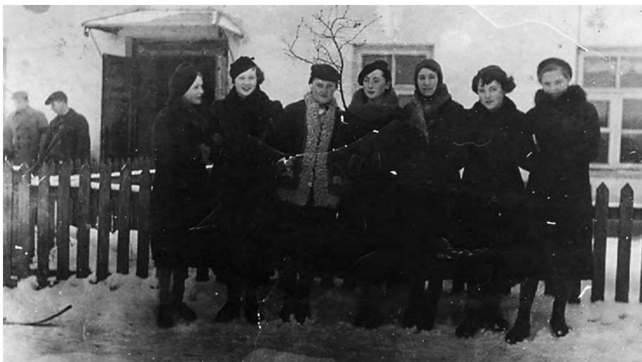
Rok 1928. Nauczycielka z uczniami w szkolnym podwórku przy gmachu obecnego starostwa miasta

Do I wojny światowej nauka odbywała się w języku rosyjskim. Ludność polskojęzyczna była pozbawiona prawa kształcenia swych dzieci w języku ojczystym. Szkoła mieściła się w gmachu dzisiejszego starostwa niemenczyńskiego.