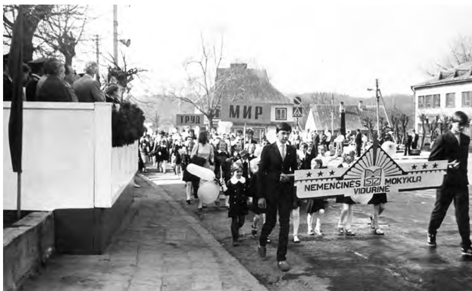
Rok 1986. Na defiladzie z okazji Święta Pracy 1 maja

W latach 2010-2012 wykonano renowację pomieszczeń i budynków gimnazjum. Wartość prac wyniosła około 3 mln litów: 1,63 mln lit - środki unijne, 1,35 mln lit - środki z budżetu Samorządu Rejonu Wileńskiego i funduszu Stowarzyszenia „Wspólnota Polska”. Szczególnie jesteśmy wdzięczni władzom samorządowym za stałą opiekę i wsparcie. Prace renowacyjne nie są ukończone. Czekamy na jeszcze wiele przyjemnych zmian.